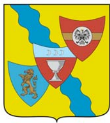
Municipio 4 Media Val Bisagno