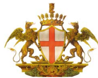
Comune di Genova